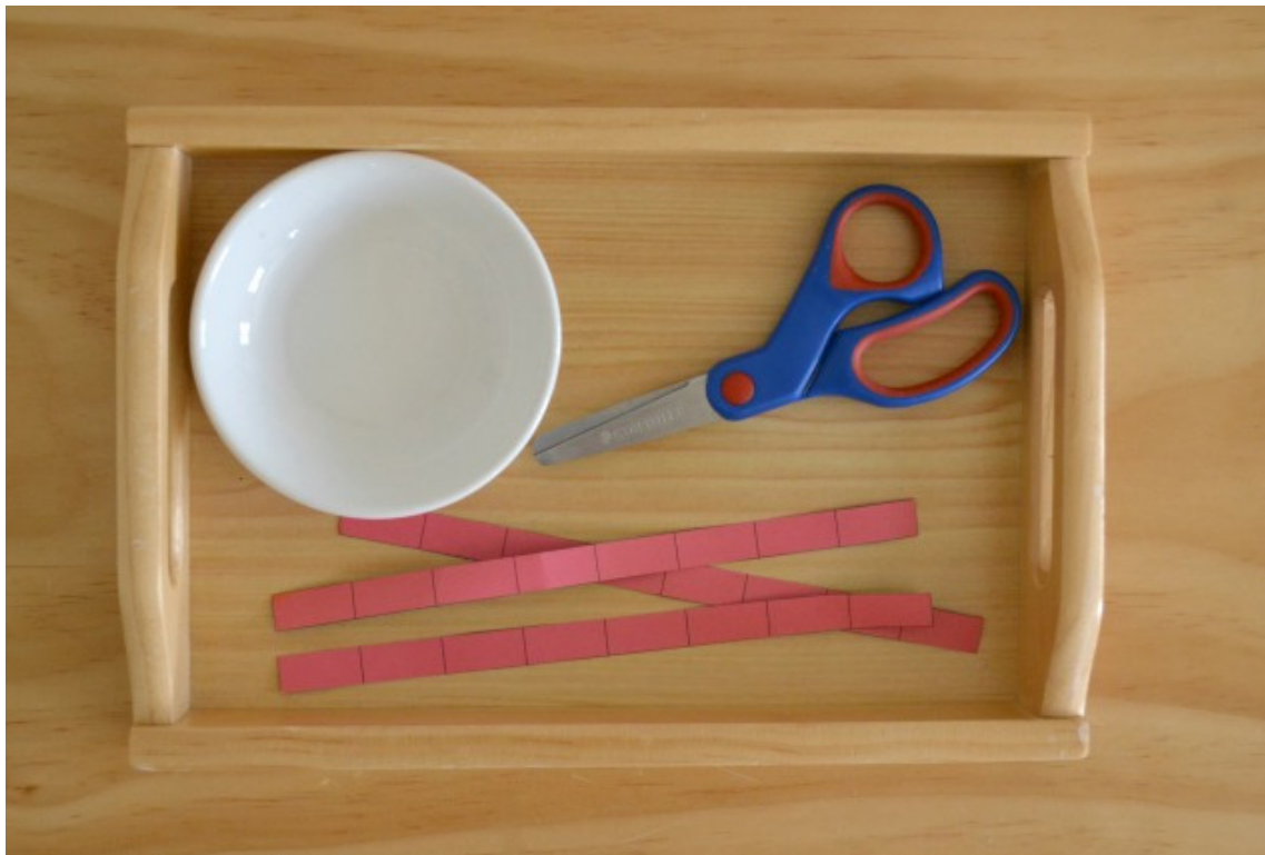
Imagen de Jaisa Educativos

Esta bandeja sería una de las más sencillas