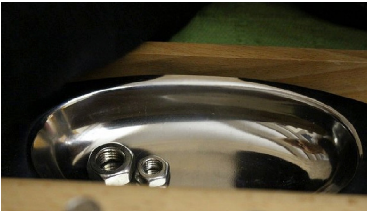
Imagen de Jaisa Educativos