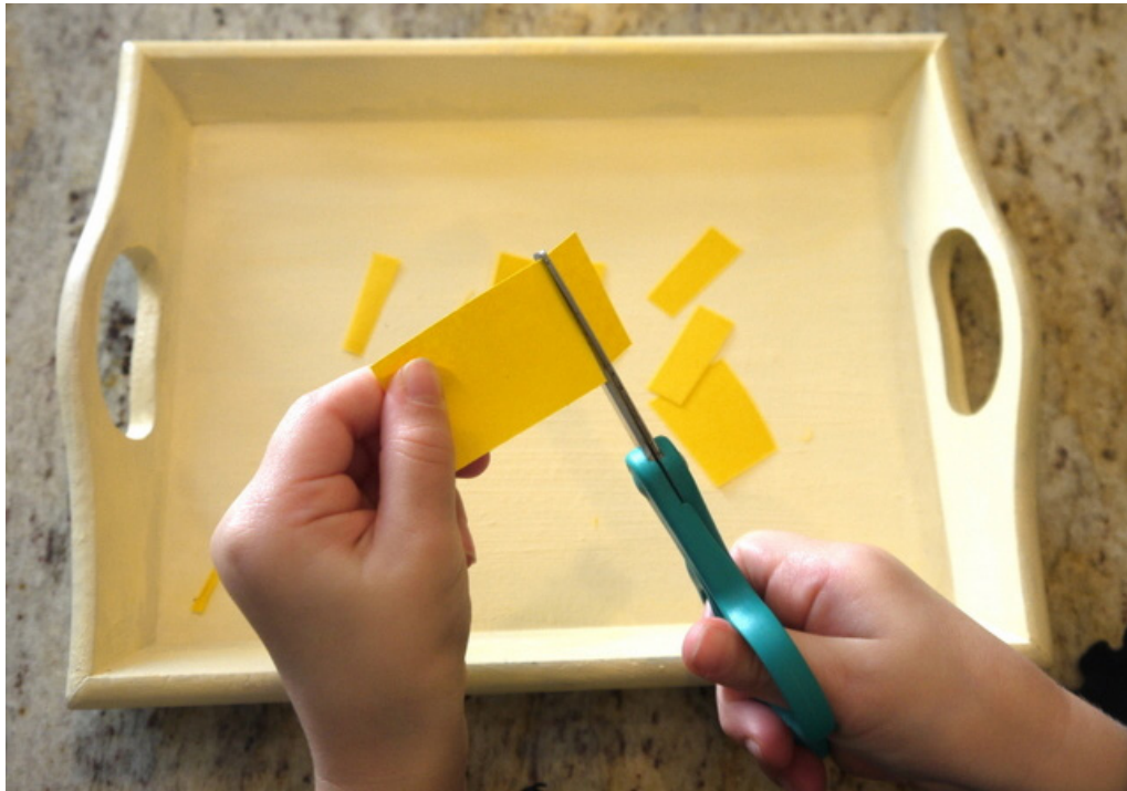
Imagen de Jaisa Educativos

En la siguiente imagen podemos ver un ejemplo de una caja de recorte con tiras de diferentes colores y diferentes tipos de línea y dificultad.