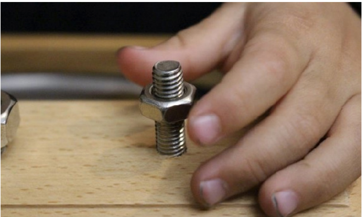
Imagen de Jaisa Educativos

En este material los tres tornillos tienen la misma altura y solo es diferente el diámetro del tornillo, de forma que tendrán que pensar más para decidir que rosca va con cada tornillo.