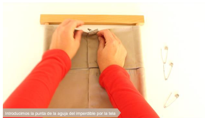
Introducimos la punta de la aguja del imperdible por la tela