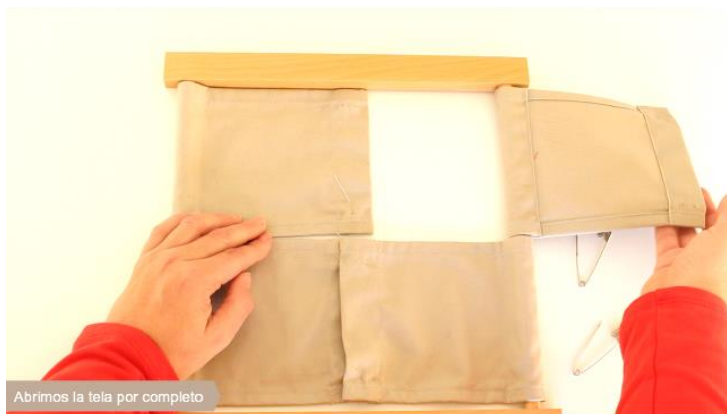
Abrimos la tela por completo