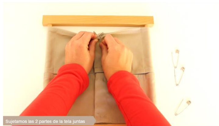
Sujetamos las 2 partes de la tela juntas