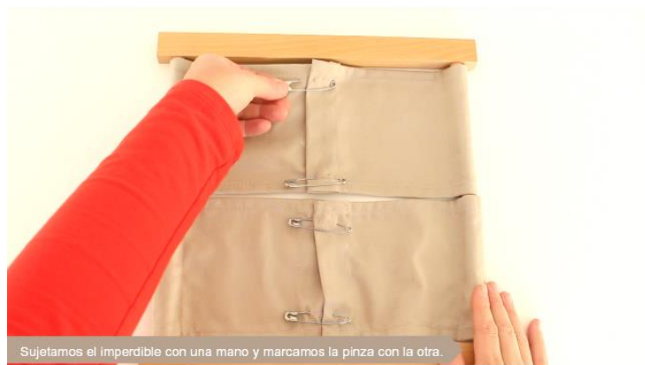
Sujetamos el imperdible con una mano y marcamos la pinza con la otra.