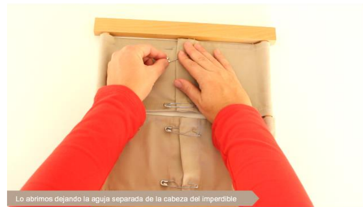
Lo abrimos dejando la aguja separada de la cabeza del imperdible