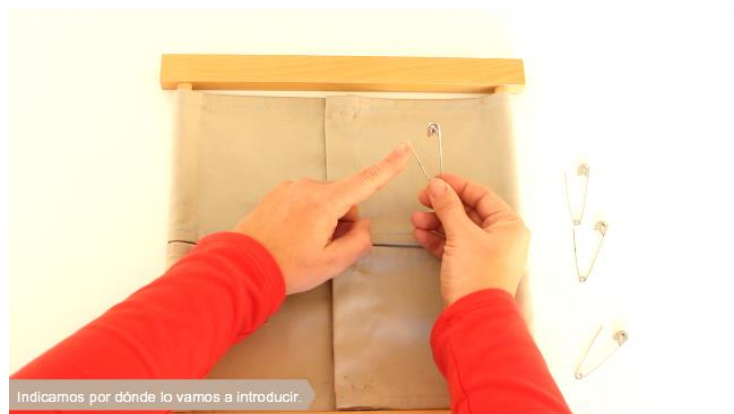
Indicamos por dónde lo vamos a introducir.