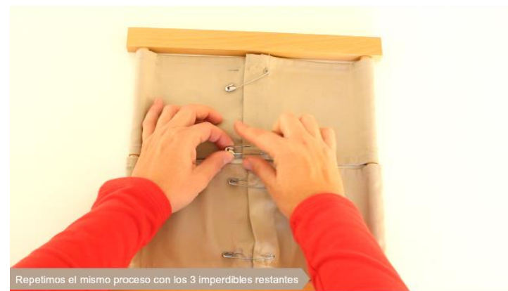
Repetimos el mismo proceso con los 3 imperdibles restantes