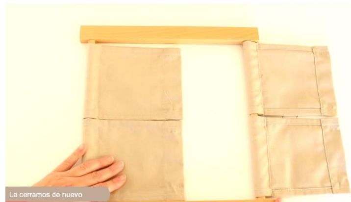
La cerramos de nuevo