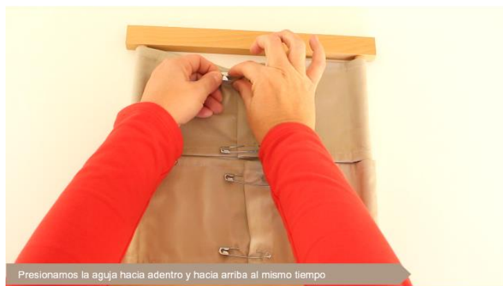
Presionamos la aguja hacia adentro y hacia arriba al mismo tiempo