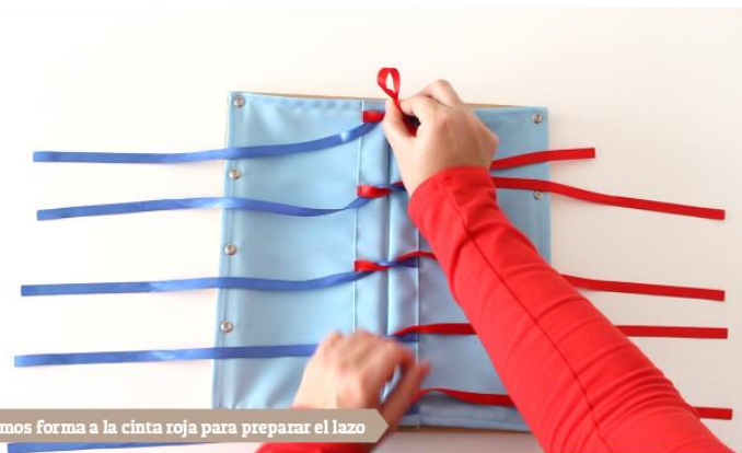
Damos forma a la cinta roja para preparar el lazo