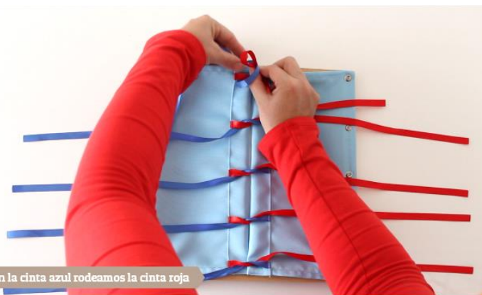
Con la cinta azul rodeamos la cinta roja