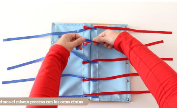
Repetimos el mismo proceso con las otras cintas