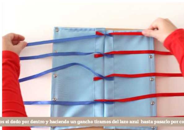
Pasamos el dedo por dentro y haciendo un gancho tiramos del lazo azul hasta pasarlo por completo