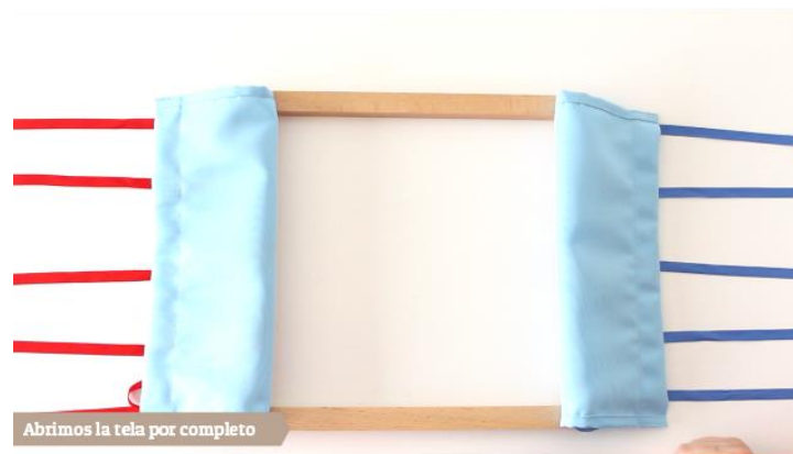
Abrimos la tela por completo