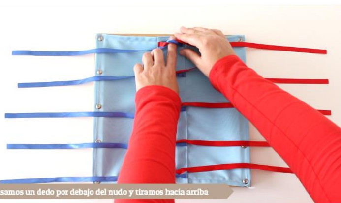
Pasamos un dedo por debajo del nudo y tiramos hacia arriba