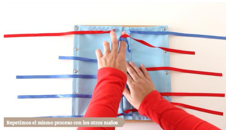
Repetimos el mismo proceso con los otros nudos