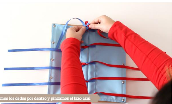
Pasamos los dedos por dentro y pinzamos el lazo azul