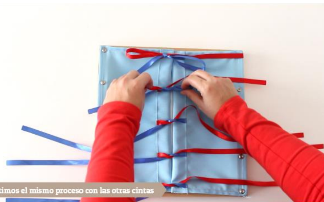
Repetimos el mismo proceso con las otras cintas