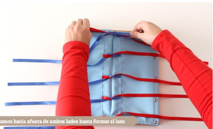
Estiramos hacia afuera de ambos lados hasta formar el lazo