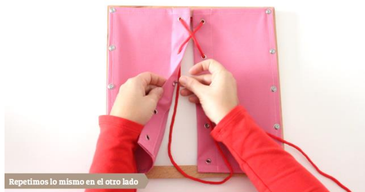
Repetimos lo mismo en el otro lado