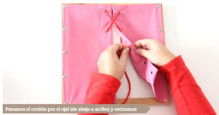
Pasamos el cordón por el ojal (de abajo a arriba) y estiramos