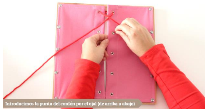
Introducimos la punta del cordón por el ojal (de arriba a abajo)