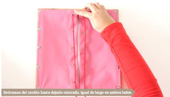
Estiramos del cordón hasta dejarlo centrado, igual de largo en ambos lados.