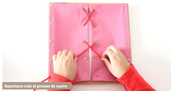
Repetimos todo el proceso de nuevo