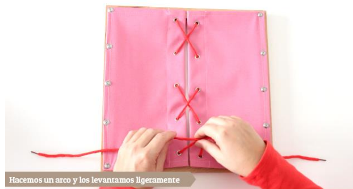
Hacemos un arco y los levantamos ligeramente