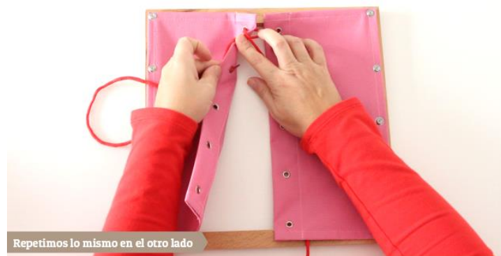
Repetimos lo mismo en el otro lado