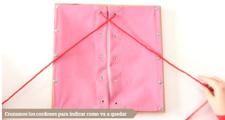
Cruzamos los cordones para indicar como va a quedar