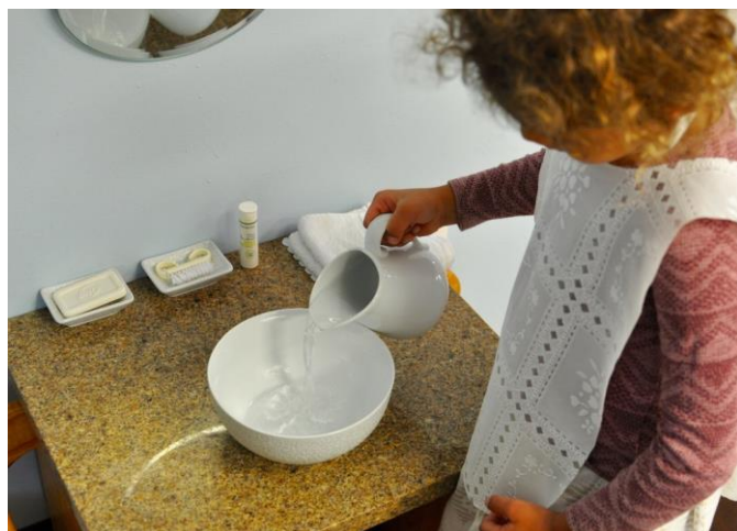
Imagen: Vila di Maria Montessori