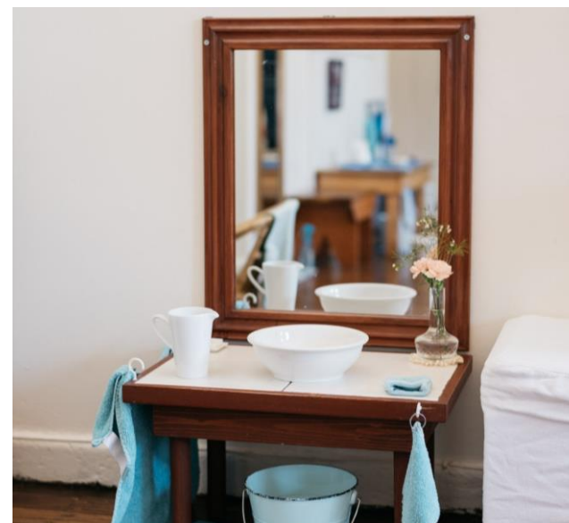
Imagen: Inner Sidney Montessori School