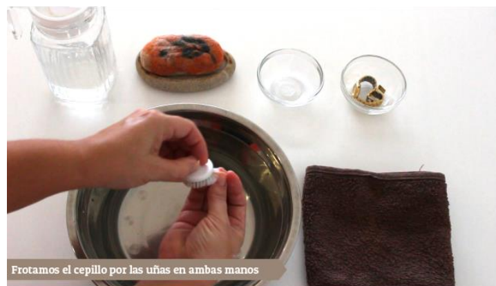
Frotamos el cepillo por las uñas en ambas manos