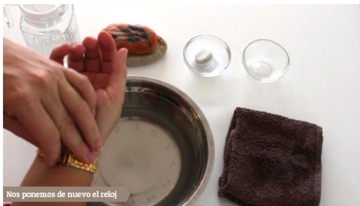
Nos ponemos de nuevo el reloj