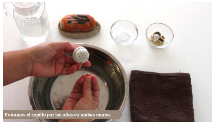
Frotamos el cepillo por las uñas en ambas manos