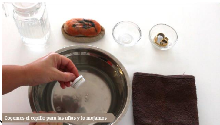
C Cogemos el cepillo para las uñas y lo mojamos