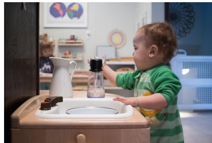
Imagen: The kavanaug report