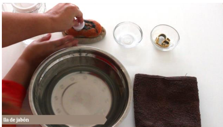
lila de jabón