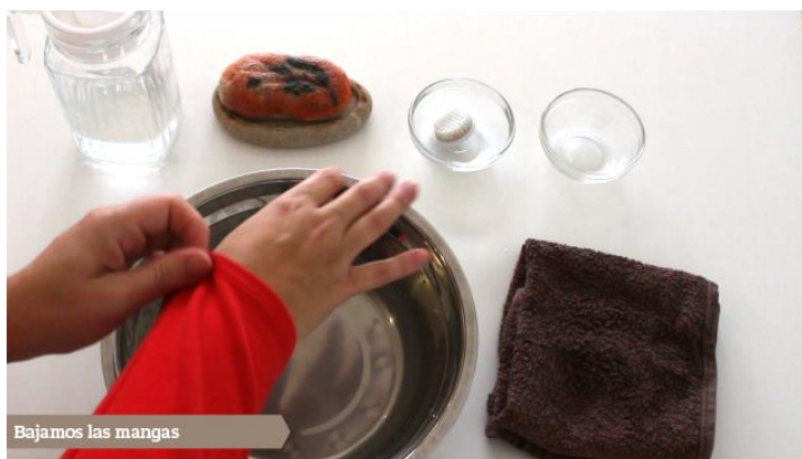
Bajamos las mangas