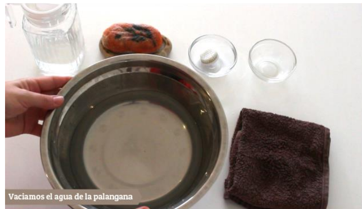
Vaciamos el agua de la palangana