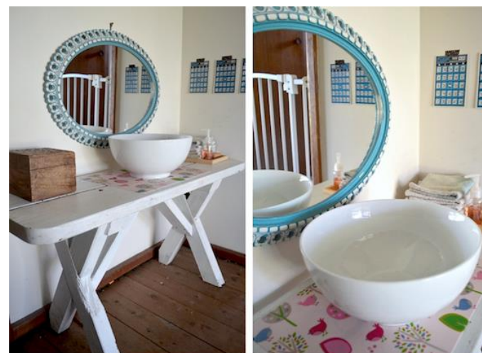
Ilustración Imagen de patch work cactus