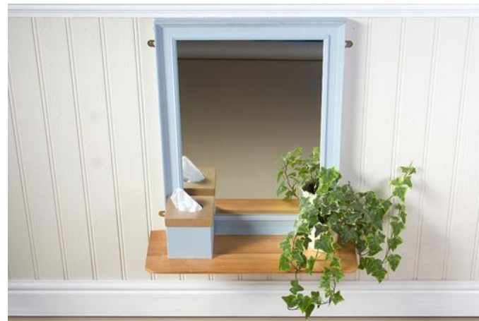
Montessori Design by nuccia